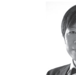
武田 真一 フリーアナウンサー