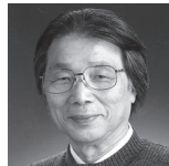
三井所 清典 日本建築士会連合会 名誉会長